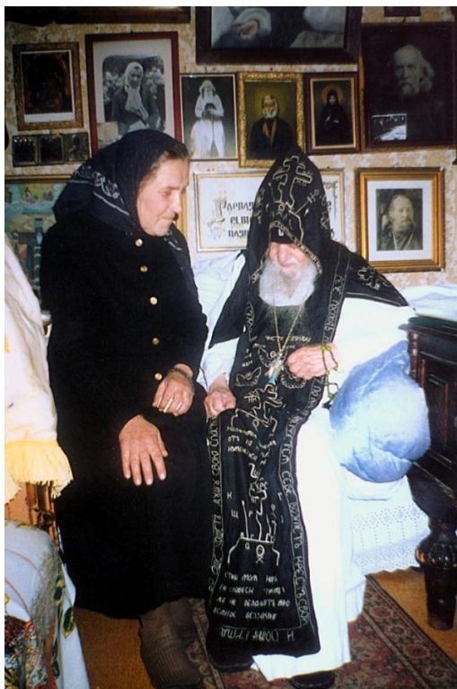
Октябрь 1996 г.

...Вот, ко мне часто приходят и говорят: батюшка, хочу в монастырь. Но ты же имей в виду, что в монастырь идешь не в дом отдыха, а в дом подвигов! Там ты должен будешь бороться против своих немощей. Там, где тебя будут гладить по головке, терпению, смирению и кротости не научишься. А вот когда «против шерсти», тогда и будешь учиться быть смиренной и кроткой.